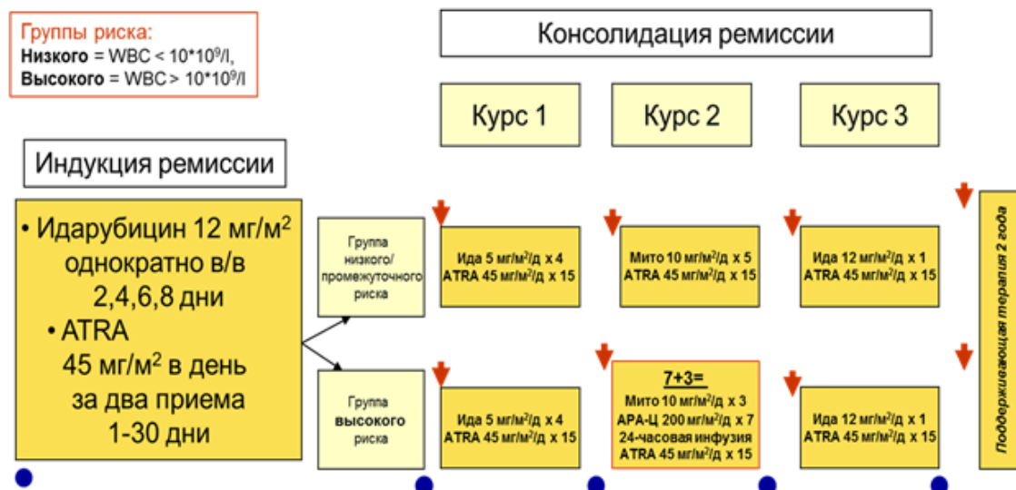
Схема лечения ОПЛ по программе AIDA/mAIDA [4,37,56]